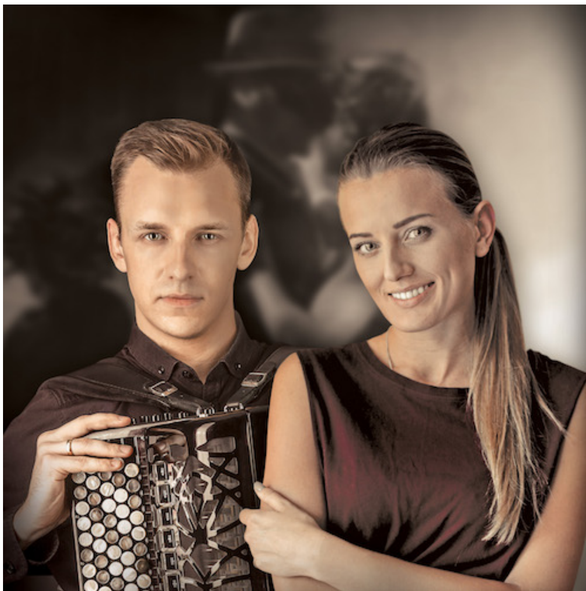
Fot.: W. Stekla, P. Prokopowicz. Projekt graficzny: Maciej Totwiński

gatunku, nieznane dotąd rejony wolnej interpretacji znanych tang, które przez wielu mogą zostać uznane jako awangardowe lub nawet rewolucyjne.